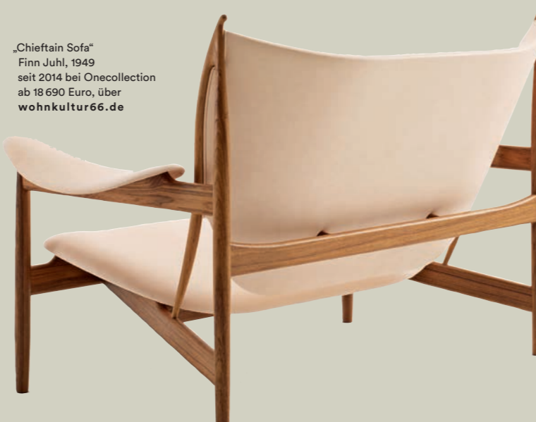
„Chieftain Sofa“ Finn Juhl, 1949 seit 2014 bei Onecollection ab 18 690 Euro, über wohnkultur66.de

Nein. Ich arbeite an der Schnittstelle zwischen Industriedesign und Handwerk – und ich bin überzeugt, die Koordination von beiden Bereichen hat einen ebenso großen Anteil daran, dass am Ende ein gutes Produkt entsteht. RK